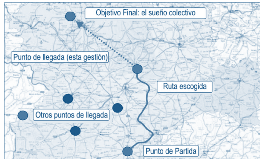
Gráfico No. 3. Estructura Básica de un Mapa de Ruta