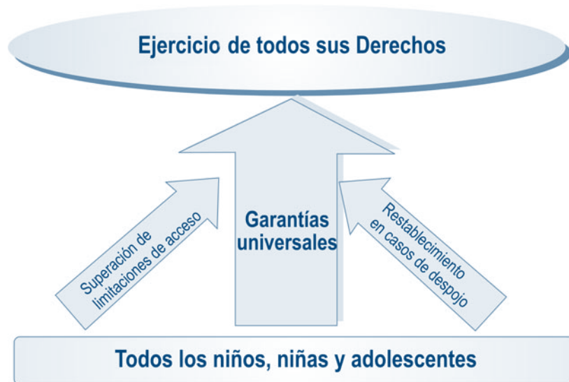
Gráfica No. 2. Los tres ejes de la política pública de Infancia y Adolescencia